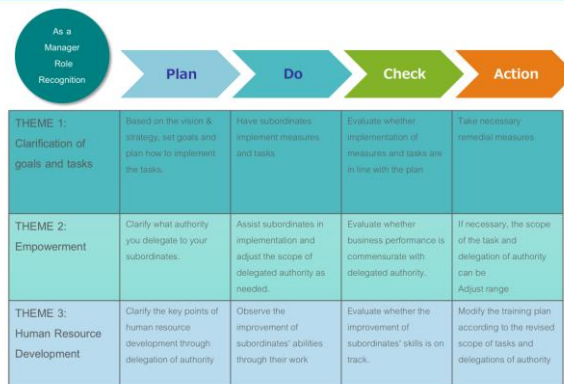
Overall picture of organizational management capabilities